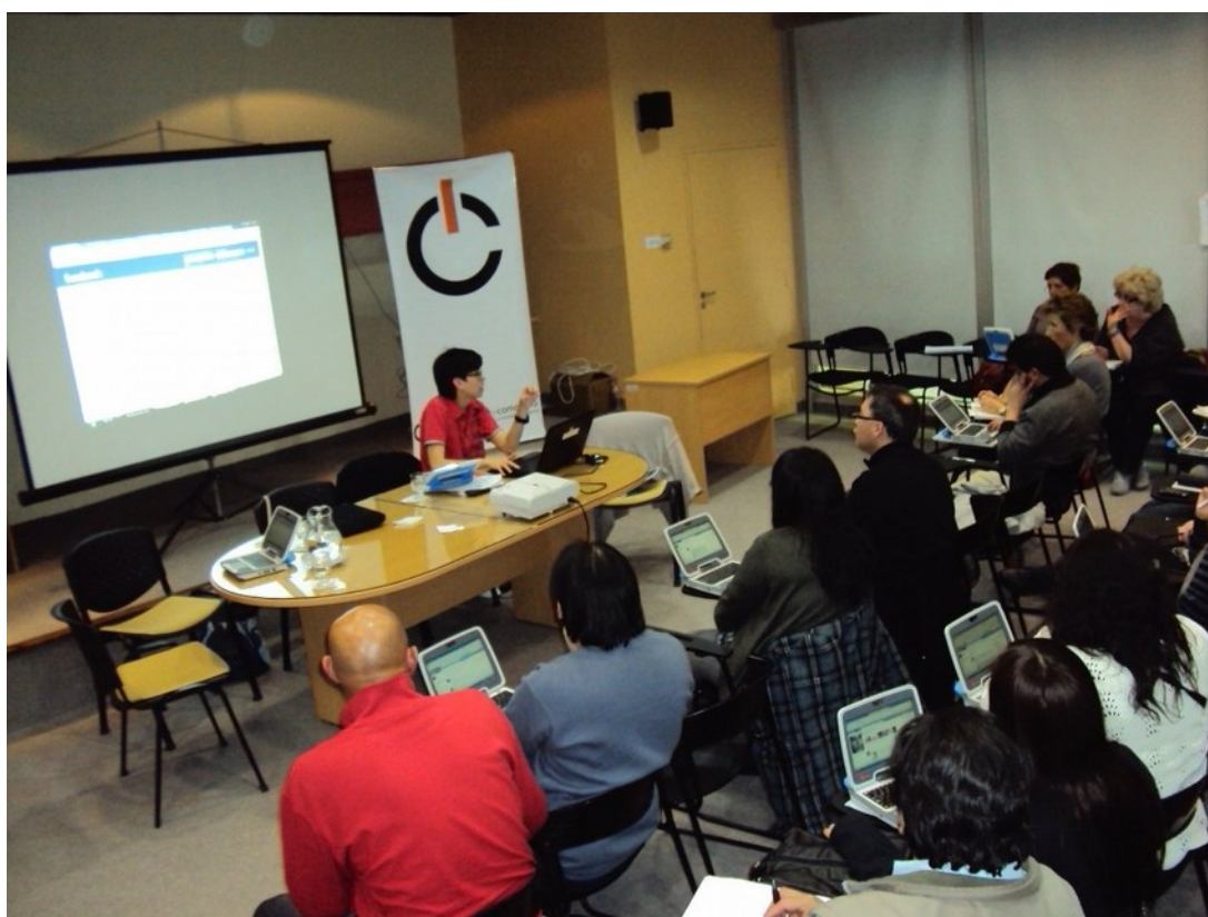
Charla introductoria a la segunda etapa del programa

En el mes de agosto se lanzó su convocatoria a las OSC interesadas en postularse para participar del Programa. Las capacitaciones estuvieron divididas en unidades temáticas que abarcan la creación de un sitio web, plataforma de publicación (WordPress), sistemas de republicación (YouTube, Flickr, PhotoPeach, SlideShare, Scribd), gestión de comunicación y posicionamiento online y redes sociales (Facebook y Twitter).